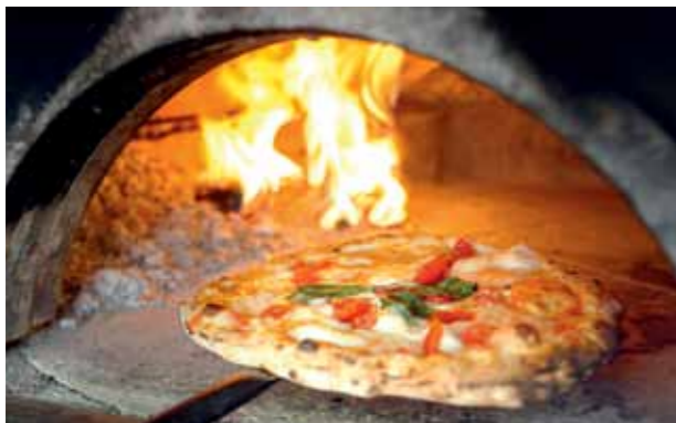
PIZZA: DE CULINAIRE TROTS VAN NAPELS.