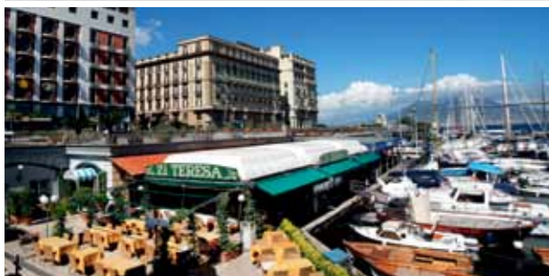
HET ZONOVERGOTEN TERRAS VAN ZI' TERESA.