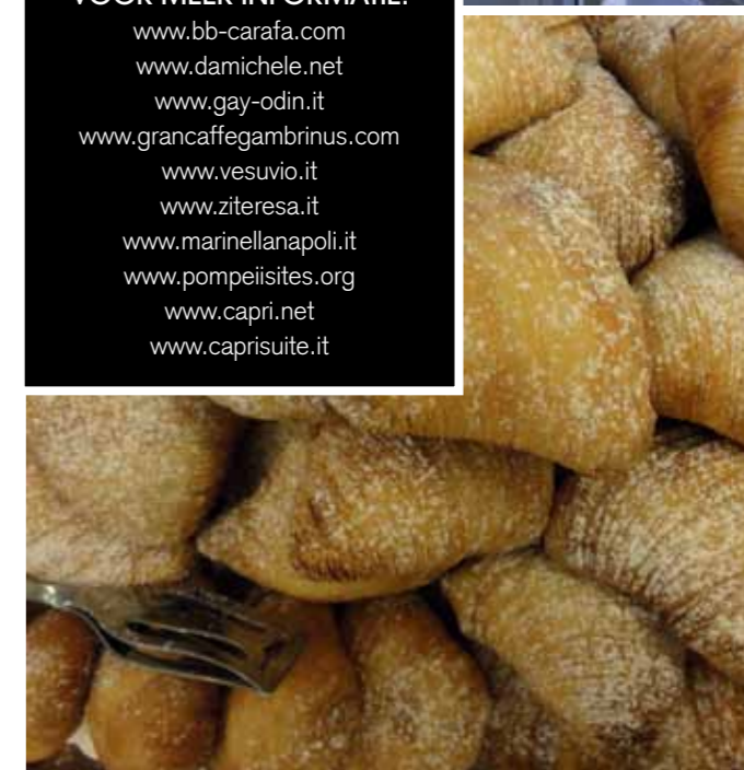
SFOGLIATELLE ZIJN TYPISCH NAPOLITAANSE GEBAKJES.