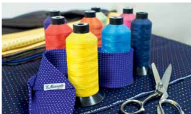
BIJ FAMILIEBEDRIJF E. MARINELLA STAAT VAKMANSCHAP HOOG IN HET VAANDEL.