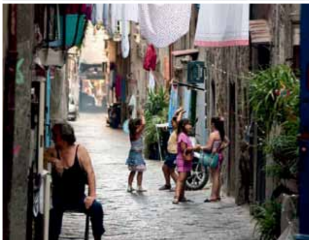
EEN STEEGJE IN NAPELS.