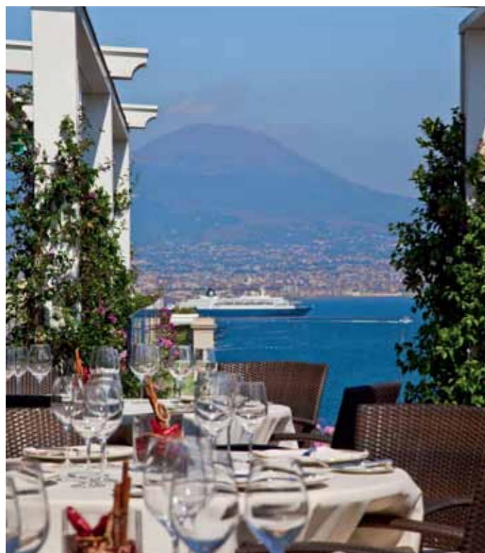
DINEREN OP HET DAKTERRAS VAN GRAND HOTEL VESUVIO.